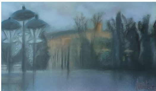
Slika »Pogled na promenado s Tivolskega gradu«

Tvoje toke ni več na ljubljenem licu. Šepet umira v ostrini večera. Poljub ne drsi po pramenu las. Klopce v Tivoliju se potapljajo v svit jutra za druge pare.