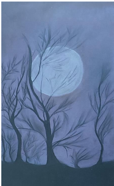
Slika »Luna«, Nika Ban Sulič