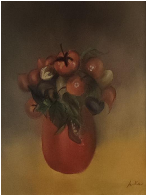
Slika »Cvetice«, Nika Ban Sulič