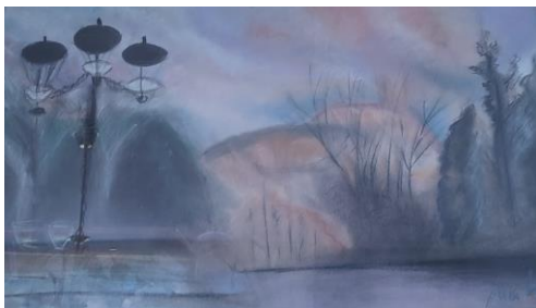
Slika »Pejsaž«, Nika Ban Sulič

Prišla si kot plamen. A boječ, v strasteh, se bojim, spet ostati sama.