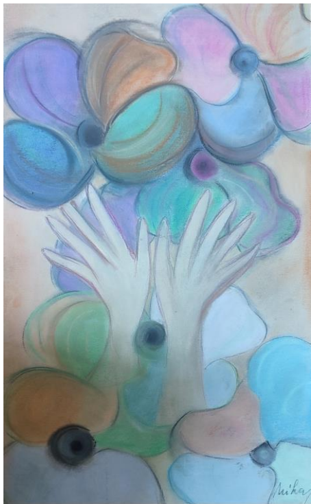
Slika »Želja«, Nika Ban Sulič