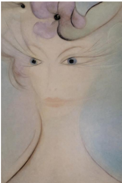
Slika »Prijateljica«, Nika Ban Sulič