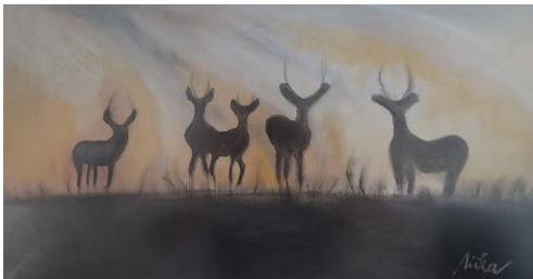
Slika »Jeleni«, Nika Ban Sulič