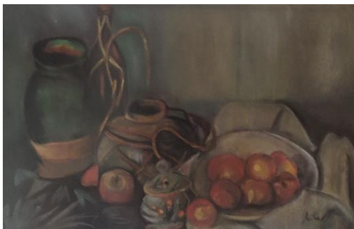
Slika »Tihožitje po Cezannu«

In samota bo pela pesem, ki bo umirala iz dneva v dan.