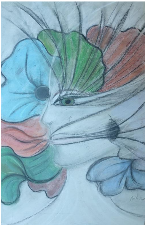
Slika »Veter sreče«, Nika Ban Sulič