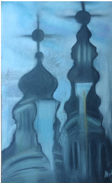
Slika »Odsev Nunske cerkve v bližnji stavbi«, Nika Ban Sulič