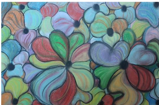
Slika »Cvetovi«, Nika Ban Sulič