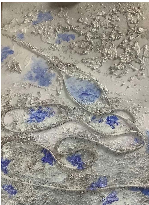
Tok reke skozi pokrajino, Lidija Bračko