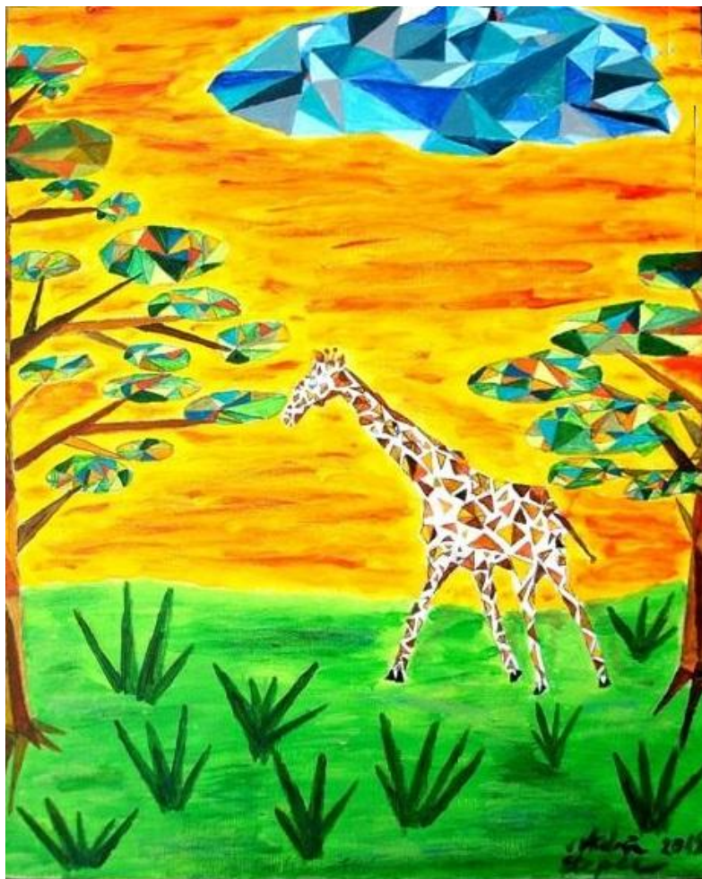
Žirafa v divjini, Andreja Štepec