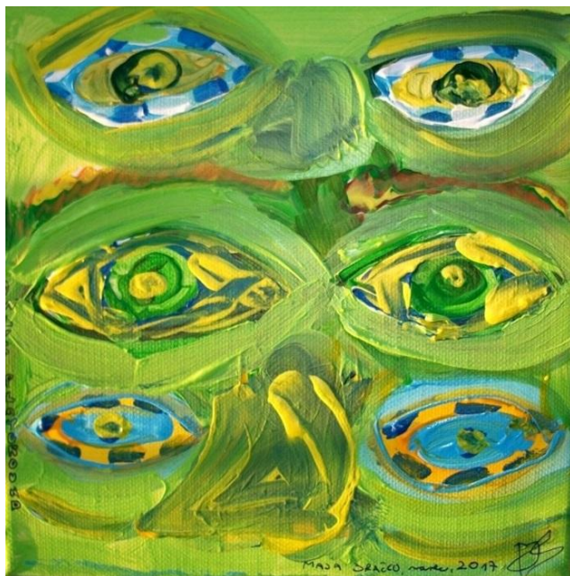
Owl's Playground, Maja Bračko

Mojstri so ga opazili, vsi bili so tiho in ga prikriili.