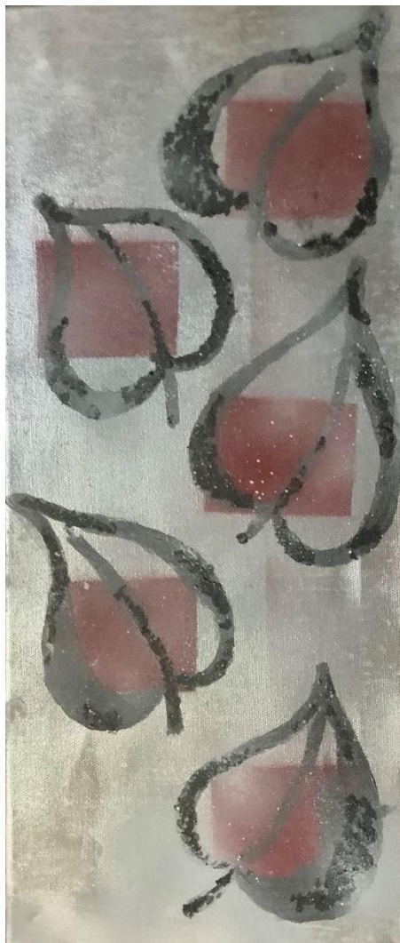
Listje pozimi, Lidija Bračko